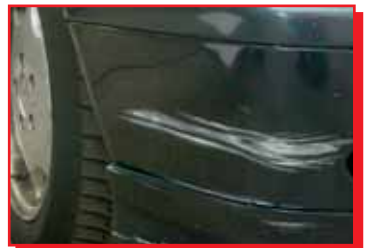
Niet acceptabel, door lak heen