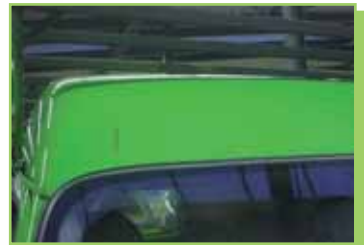
Acceptabel op bedrijfswagen