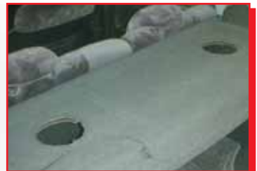
Niet acceptabel, de ruimte was er niet voor gereserveerd

Luidsprekergaten zijn acceptabel indien daar in de auto ruimte voor was gereserveerd.