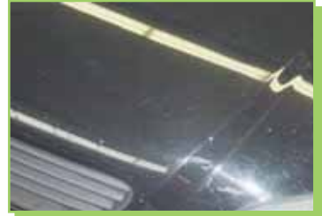
Acceptabel bij meer dan 100.000 km